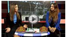
כמה עלתה דירת 3 חדרים בירושלים?