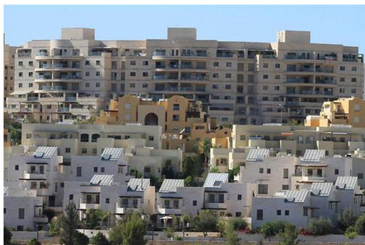
מודיעין. הציון מצוין

ניכר שהתאגידים שקיבלו ציון נמוך או בעלי תפקוד לקוי רוחים במגזר הערבי. "יש תאגידים במגזר שמתפקדים נהדר", מנסה נוסבויס לגונן. "בדרך כלל המצב נובע מתשתיות פחות טובות שקיבלו מלכתחילה. כרגע שתאגיד קיבל עיר עם אחוזי פחת מים גבוהים, אחוזי גביה נמוכים ותשתיות שאף פעם לא השקיעו בהם, הם מתחילים מרף נמוך יותר".