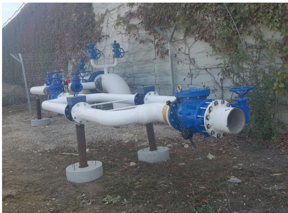
חיבור מקורות חדש לאיזור תעסוקה חדש במזכרת בתיה