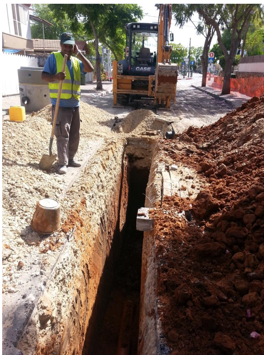
הנחת קווים בקריית עקרון