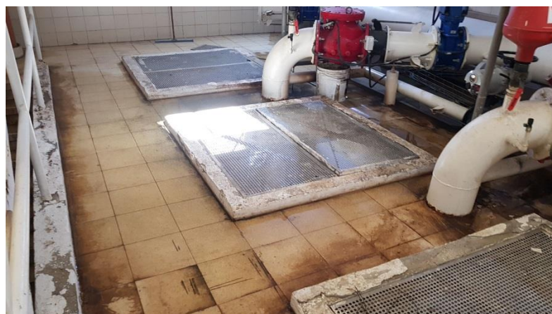
מכון שאיבה לביוב