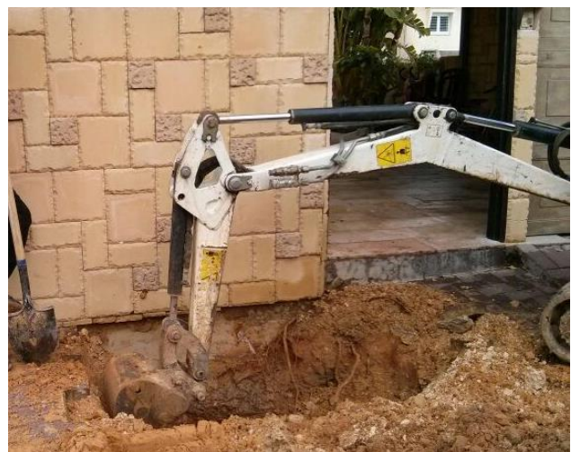
תיקון פיצוץ מים