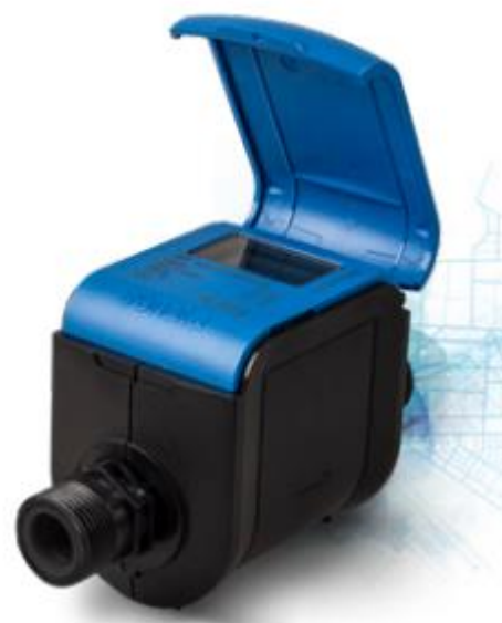
מד מים סונטה